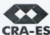
image001.png 6 KB

Profissional reconhecido é Profissional registrado!