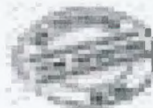
image002.jpg 903 B